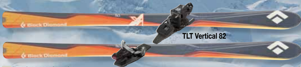
TLT Vertical 82