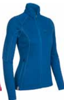
Cascade Full Zip € 159,90