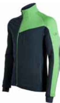
Carve Zip € 189,90