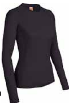
Oasis Crewe € 79,90