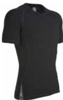
SS Sprint Crew € 79.90