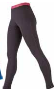
BF200 Legging € 69,90