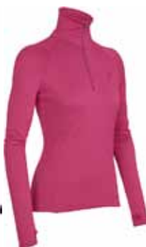
Tech Top € 99,90