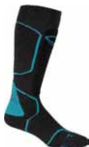
Ski+ Mid € 29,90