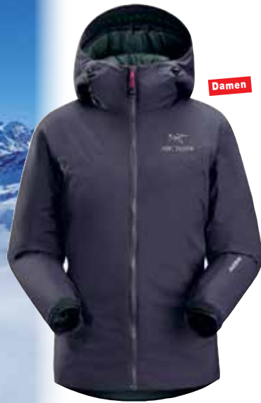
W's Kappa Hooded Wetterfeste, top-verarbeitete Isolationsjacke für sämtliche Outdooraktivitäten. XS - XL, 628 g. 400,-