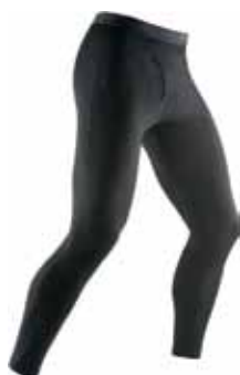
BF260 Legging € 84,90