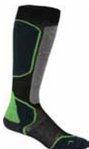
Ski+ Lite OTC € 26,90