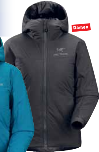
W's Atom SV Hooded Atmungsaktive, bequeme, sehr leichte, gefütterte Coreloft- Isolations-Jacke. S - L, 412 g. 230,-