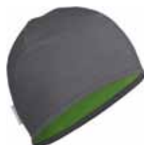
Pocket200 Hat € 29.90