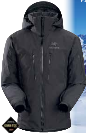
M's Fission SV Jkt. Wärmste wattierte GORE-TEX® Proshelljacke von Arc'teryx! 100% wasserdicht. S - XL, 950 g. 600,-