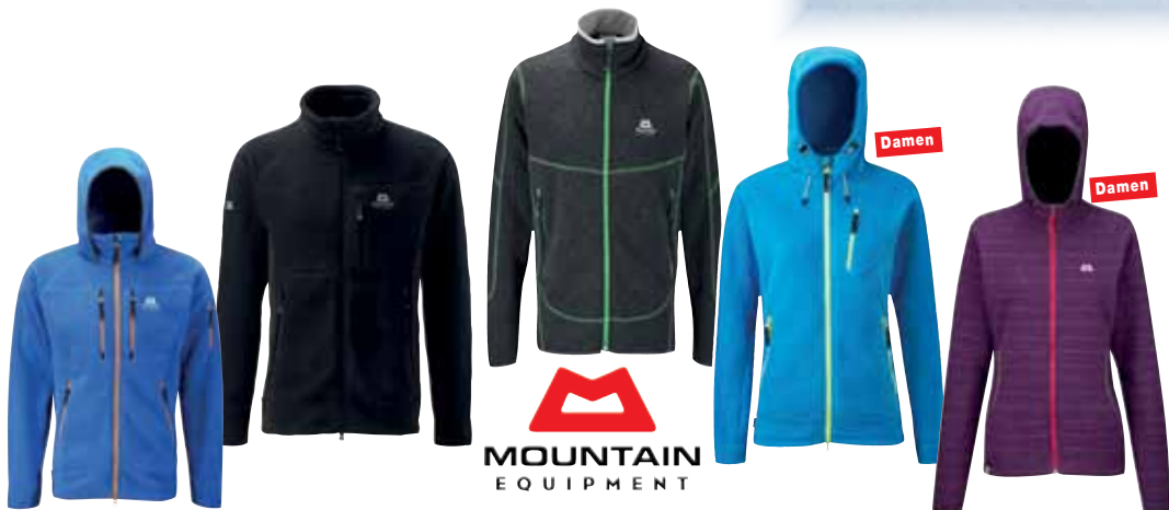
Touchstone Jkt. Warme, elastische, technische Polartec® Thermal Pro Fleece- jacke, S - XXL, 630 g. 149,90