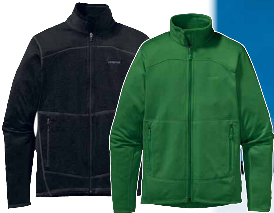
patagonia® R1 Full-Zip Jkt. Micro-Fleecejacke mit hohem Tragekomfort für sämtliche Outdooraktivitäten. S - XL, 366 g. 130,-