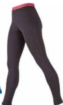
BF200 Legging € 69,90